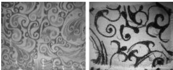
图2、图3:马王堆一号汉墓出土的精美刺绣丝织品 土的带有精美刺绣图案的丝织品,纹样活泼,富于动感。图4、图5,是同时出土的织花丝织品,由于早期的提花织物受到织花工艺的限制,故多以规则的几何纹样出现,最有代表性的是“菱形纹”,几何纹样的丝织品展示出了一种对称、稳重、规矩的静态美特征。

早期丝绸面料上的图案多由绣、织、绘三种基本手段进行,其中以刺绣纹样装饰占有相当重要的位置和很大的比例。刺绣相对于织花工艺要纤巧灵活许多,因此图案多为无固定格局限制的云气纹,呈现出自由变化的特点。图2、图3,是在马王堆一号汉墓中出