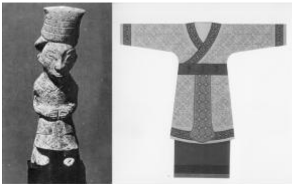
图6(a/b):周代“上衣下裳”形制的服装,交领,佩戴蔽膝

中国古代商周时期主要采用“上衣下裳制”,衣服的领、袖及边缘饰以花纹图案,腰间则用缘(tao1)带系束,佩系一块窄条梯形的蔽膝,见图6(a/b)。