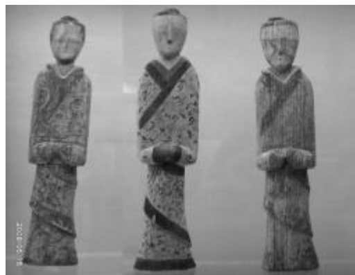
图8: 汉代“续衽钩边”的曲裾深衣

深衣是继上衣下裳服装形制之后在春秋战国时期形成和发展的中国古代另一种十分重要的“衣裳连属”制服饰类型。“续衽钩边”是指:“深衣的襟式。前襟接长,做成斜角,著时由前绕至身背,用带系结。” [4] 见图8。从出土的大量深衣墓俑来看,续任钩边螺旋缠绕式样的曲裾式样具有相当的典型性,而且从颈部观察,多见三层衣领,说明当时盛行穿“三重深衣”。这种以多层缠绕交叠的方式解决了丝绸面料服装透明不雅观的问题,也从一定角度上解释了为什么深衣不配穿蔽膝的疑问。同时续衽钩边还具有压服轻薄飘逸丝绸服装,以防行步时露出里衣,有失礼仪之功用。深衣的流行在西汉时期达到了高潮,与此同时,禅衣形制完善,还出现了合裆裤,为深衣的变化与日后的淡出以及袍衫的盛行打下了基础。