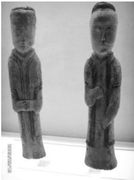
图7: 马王堆1号汉墓出土的着对襟衫的木俑 数都是交领的式样,但也出土了少量的如图7中的对襟式服装。值得注意的是:这种早期为数不多的对襟式样的服装都是作为长型外衣穿在深衣或其它衣裳之外,呈直线造型,缘边装饰,对襟处自由开合。

同样,从中国古代丝绸服装面料特点的角度来分析,也可以找到此衣款形制相应的成因。对襟款式的服装,由于衣襟部分没有交叠,使得丝绸面料轻薄透明的特点凸显,不适于作为独立穿着的服装。而当其作为外衣套穿在其他衣裳之外时,则既能发挥丝绸面料温雅华丽外观的优势特点,又有里外衬映含蓄美的视觉效果,还避免了单层贴身穿着过于透明不雅的问题。此外,长型的款式,加以缘边装饰,更能体现出丝绸面料滑顺悬垂的效果。此种对襟式长外衣款,之后作为中国古代服装的典型式样历代流传,其中宋代的褙子最具影响力和代表性。