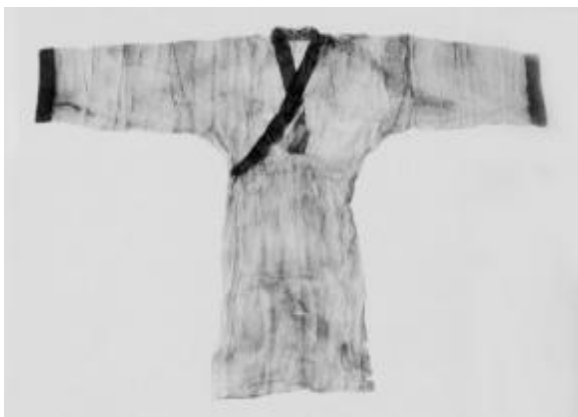
图1:马王堆1号汉墓出土的素纱禅衣

工的丝织品和装饰衣物用的窄带缘等” [2] 。根据绢的粗细不同还有缟、素、缣、纨等名称。以上述丝织品分析不难看出:除了织锦相对比较厚实之外,其它丝绸品种都为轻薄型,具有透明和飘逸的特点,尤其广为应