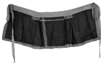
图 2: 百衲作裙

叠压缝制而成，看上去略显上窄下宽，这是由于两侧裙腰收衲而形成。(图 2) 上端配有腰头，腰头两端缝有系带；(5) 大裆裤：由黑色主体部分分配以本白腰