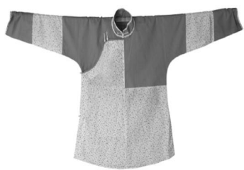
图 1: 拼接衫

腰”配有手针缝制的细密针脚作为装饰；(4)作裙：又称“百衲作裙”，以两片相同的矩形布幅前后