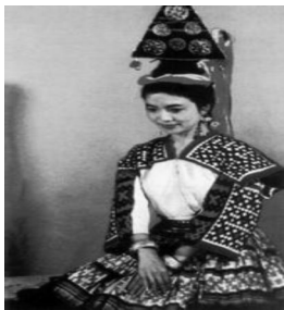
图 13: 云南蚩尤帽(银围帕)

另一种形制是整体银制,内衬布垫或直接固定在头上。围帕的银饰图案有涡纹、鱼纹、圆锥、铜鼓等。贵州苗族银围帕采用蓝布,上下两排对称钉住二十个涡纹银帽饰,蓝白相衬,相当益彰(图 12)。云南禄劝、武定、安宁大花苗妇女的蚩尤帽(图 13)其帽形是三角形,上面装饰 9 个大小不一、排列规整的涡纹银饰。