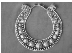
图 18: 银胸牌