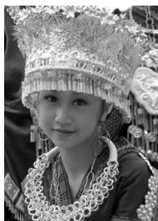
图5:湘西地区的花鸟帽

突出立体装饰性,层次感极强,并作颤枝处理,银帽整体轻、薄、美。帽沿下低垂一整圈银流苏,苗族少女举手投足间,银花晃动、流苏轻摇,眉眼生情、顾盼生姿,整个银帽被注入了