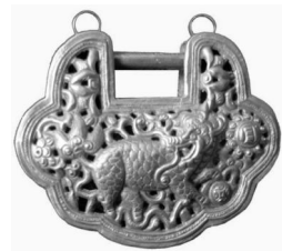
图 19: 银锁

银胸牌(图 18)也是由长命锁演变而来,形状规整,一般是单层长方形或半圆形簪花银片制成,佩戴的位置较银压领、银锁(图 19)靠上。这三种银饰在同一苗族分支内通常只使用其中一种,不会出现三种并存。