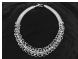
图 15: 麻花银项圈

湘西、鄂西地区胸饰多为银压领(图 14),中部苗族代表黔东南、黔西、黔西南地区胸饰多为麻花银项圈(图 15),西部苗族代表滇川琼地区大多无颈饰,以银披肩代替,即使用到项圈也是涡纹、鱼纹雕花银项圈(图 16)。造型古朴、简单大方。