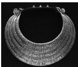
图 16: 雕花银项圈

湖南湘西和贵州清水江流域苗族地区流行银压领,银压领体积大,工艺复杂,纹样丰富。主要为腰子形,造型取自长命锁,形制脱离原型较远,为半圆