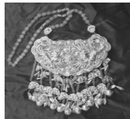
图 17: 链型银项圈

中部苗族多佩戴银项圈,银项圈制作十分考究,造型极其多样,按外形分为圈型和链型两种,圈型以银片或银条固定成型不能活动,式样有羊角圈、圆光圈、扁圈、盘圈、麻花圈、雕花圈、戒指圈、空心镂空圈以及由项圈等。项圈使用量较多的有湖南湘西一带及贵州的松桃、剑河、台江、黄平、凯里、雷山、丹寨、麻江。贵州苗族还流行一种银排圈、套圈,即每套项圈或几个或十几个组合,由内到外圈径逐渐加大。呈现了苗族银饰以“多”为美的艺术特征。而链型银项圈(图 17)以链环相连,能活动变化。少数民族亦有链圈合一的。