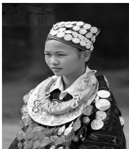
图 12: 贵州银围帕