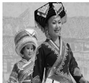
图11:云南文山银围帕