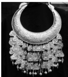
图 14: 银压领

苗族银饰除了头饰格外引人注目外,也十分重视胸颈部位的装饰,胸颈饰重叠繁复,极为美观,胸颈饰主要包括:银压领、银项圈、银胸牌、银锁、银吊饰等。东部苗族代表