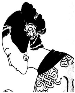
图8:清代汉族女子(吴友如《海上百艳图》局部)

“男从女不从”,就是男子一定要仿照满族男子剃头梳辫子,而女子仍旧梳原来的发髻(图8),不强迫学旗人女子梳两把儿头或燕尾头,这对于保留汉族女性服饰有很重要的意义。