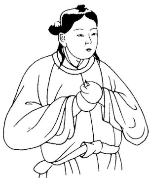
图7:髡发的辽代妇女(河北宣化下八里2号辽墓壁画)

着很大的区别。生活在中国北方的游牧民族姑娘就喜欢髡发。因为与披发、辫发或者发髻相比,髡发更加轻便和省事,便于骑马行动(图7)。