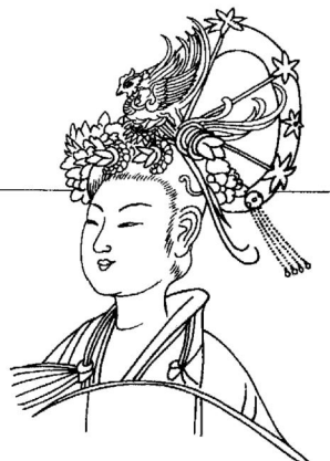
图10:梳仙人髻的妇女(宋·武宗元《朝元仙杖图》)

后来随着人们生活经验的逐渐丰富、梳理技术的提高、审美的改变和进入礼仪社会后的约定俗成,女性的发式开始往复杂多样发展。除了辫发,各种发髻的复杂程度让现代人叹为观止,光史书上有记载的就有椎髻、堕马髻、倭堕髻、单髻、双髻、元宝髻、灵蛇髻、飞天髻、辘子髻、惊鹊髻、盘恒髻、凌云髻、乌蛮髻、回鹘髻、螺髻、双鬟望仙髻、三角髻交心髻、峨眉髻、朝天髻、同心髻、鸾凤髻、仙人髻、牡丹髻等。 [17] 有很多发式本身就已经成为了一件精美的艺术品,如仙人髻的精巧与精美让人直呼此发只应天上有,人间难得几时见了(图10)。