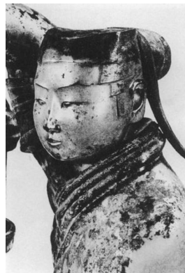
图4:汉·铜人中女子发髻(河北满城出土)

中国古代女子到了成年要行笄礼,成年便可许嫁,在出嫁之日,要行结发之礼,且在成亲之后就不再梳丫髻,而梳少妇的发髻(图4)。假如一个女子虽已经过了婚龄而未出嫁,那么不管她多大岁数也就只能梳髻而不能梳髻。