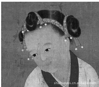
图2:宋·苏汉臣《冬日戏婴图》局部

等到婴儿(不分男女)稍长大,头发变多的时候,就将“髻”集中在头顶,分成左右两路,编结成两个像牛角状的髻,所以也被称为“总角”或者“总髻”。《礼记·内则》:“男女未冠笄者,……拂髦,总角。” [2] 唐孔颖达疏:“男子总角未冠,则妇人总角未笄也。……以无笄,直结其发聚之为两角。但是也有“男角女髻”的说法,即男童的“髻”形式为“角”,而女童的“髻”形式为“髻”,“髻”是在头顶作成十字形状,纵横各一(图2)。孔颖达疏:“一从(纵)一横曰午;令女剪发留其顶上,纵横各一,相交通达,故云午达,不如两角相对;但纵横各一在顶上,故曰髻”。如在《新唐书·员半千传》中说到: