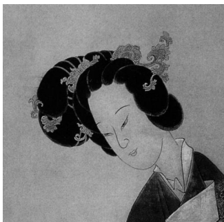
图5:清·任熊《瑶宫秋扇图》局部

记载:“余为诸生时,见妇人梳发高三寸许,号为新鲜,年来渐高至六、七寸,蓬松光润,谓之‘牡丹头’,皆用假发衬