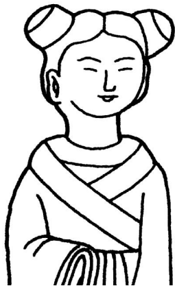
图3:梳丫髻的女子(山东高唐东魏房悦墓出土陶俑)

在女孩告别童年时代之后,就会把头发分别编成两个小髻,左右各一个,因为发式的形状如“丫”,所以也被称为丫髻、丫头或者髻丫(图3)。丫头到现代还是长辈对女孩子的昵称。唐刘禹锡《寄赠小樊》诗:“花面丫头十三四,春来绰约向人时。” [4] 宋陆游《浣花女》诗:“江头女儿双髻丫,常随阿母供桑麻。” [5] 孙周卿《折桂令·题琵琶亭》词:“家住长安,十三学乐,髻绾双鸦(同丫)。” [6] 从这些诗文中透露出梳这种丫髻的女子大多在十多岁左右。这样的发式一直到成年才变化。