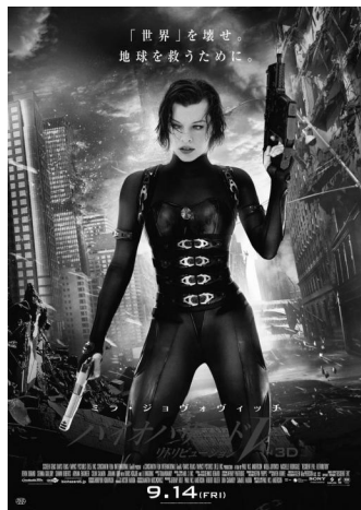
图8:《生化危机》中的服饰

“对后现代主义来说,再现的客体并非艺术创作过程中不可分割的一部分,也不是表现的主体,现代服饰设计观追求的是‘表达表