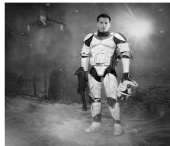
图9:《星球大战》中的服饰