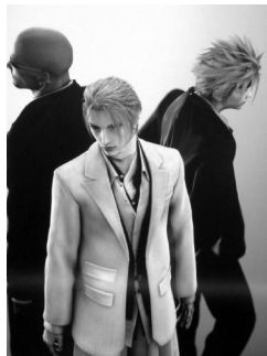
图6:《移魂都市》中的服饰

在这种看似迷宫一样的僵局里,受众还是有可能穿越意蕴的羁绊,看到后现代美学潜藏在影视服饰造型之中的整体美,这就是后现代主义创作独具魅力的不确定性。如