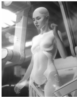
图3:《银翼杀手》中女战士服饰

《银翼杀手》(图3)中女战士的服饰在介于“现实和幻想之间”找到了传统与另类的精髓,营造了个性反叛的创意感受。其表现出解构主义现象,在原款式的基础上,将衣片