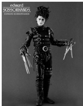
图2:《剪刀手爱德华》中的服饰

质材料上都彰显出趣味、随意而多变,风格反叛,个性张扬的意味。如《剪刀手爱德华》(图2)中带有戏剧性的服饰设计,广泛采用多元“似是而非”的材料,给人们带来了一种新奇的另类视觉效果。