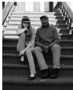
图5:《未来少女》中的服饰

往往在某个片子中，常常会出现将历史的片段似是而非地运用到设计中，造成时间感上的含混。最常见的是将历史服装取其片段与现代样式相融合，或是将历史图片印在现代样式的服装上。意大利时装设计师 Zuccoli 在米兰推出一款时装，上衣印有各种历史宗教绘画，模特头顶孟形高帽，带着一种说不清道不明的宗教情调。此类服装在我们现今日常生活中比比皆是，如T恤、衬衫、夹克甚至是西装上印、绣着中国传统的龙凤图案，或者是日本的浮世绘绘画等具有历史意味的图案。对此，人们似乎已经习以为常了。后现代影片中的角色的服饰几乎不能按照理性主义逻辑来阐释和解读，因为他摒弃了传统服饰设计理论强调的体现性、秩序感、客观性特原则，这样的审美取向使一切急于得出的结论都可能显得有些浮躁。如《未来少女》(图5)中将严肃的和休闲的、正式的和非正式的古董衣混