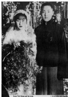
图10:《良友画报》1936年刊老照片

西方文明大大冲击了中式婚俗,婚俗由奢尚简,崇尚独立与自由的女性婚服装扮已采纳西式婚服,如图10《良友画报》1936年刊载老照片服装,搭配形式为男中式、女性西化婚纱礼服;当时较为常见的搭配形式还有以男西式服装、女中式为主,这种形式民国刊物记载较多,女性婚服有奢华的风冠霞帔(图11),有上袄下裙,还有旗袍。四川的武阳镇“行结婚仪式时,