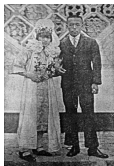
图8:《妇女时报》1914年上老照片 图9:《妇女杂志》1929年刊老照片

西方文明大大冲击了中式婚俗,婚俗由奢尚简,崇尚独立与自由的女性婚服装扮已采纳西式婚服,如图10《良友画报》1936年刊载老照片服装,搭配形式为男中式、女性西化婚纱礼服;当时较为常见的搭配形式还有以男西式服装、女中式为主,这种形式民国刊物记载较多,女性婚服有奢华的风冠霞帔(图11),有上袄下裙,还有旗袍。四川的武阳镇“行结婚仪式时,