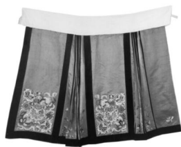
图 5: 江南大学民间服饰传习馆所藏马面裙

辛亥革命前后，裙子的结构发生了质的衍变。其一，裙身合二为一，但裙门仍保持内外两片的形制，腰头上的扣子和纽襻随之去掉，腰头也由两片式剪裁改为一片式，前后裙门两侧留有褶裥或镶边装饰（图 5）。其二，侧缝缝合。