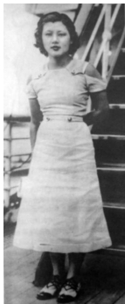
图 14: 游泳运动员

13)、年轻学生、游泳运动员(图14)皆有穿着,连衣裙在衣前、衣后或衣侧开襟的皆有,多用胸省、腰省、肩缝勾勒女性的曲线。“就其款式和材料而言,在20世纪30年底到40年期间,都已很丰富和时髦,据传世图照,各种喇叭袖的、长袖、短袖、和无袖都有;从领、肩部的造型来看,背带式、荷叶领和翻领等都有;从长度来