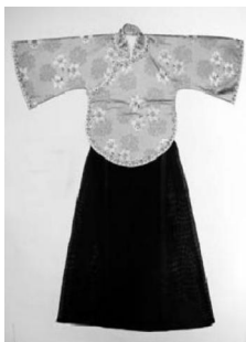
图2:五四时期女式文明新装

20世纪20年代初期,受到西方文化和西式服装的影响,文明新装开始流行,五四时期,这种文明新装由留日女学生和本土教会学校女学生率先穿着,她们呼吁服装要返璞归真,追求服装朴素、淡雅、清纯之风,民初北京女学生的装束在《厂甸竹枝词》中这样写道:“素裙革履学欧风,绒帽插花得意同。脂粉不施清一色,腰肢袅袅总难工。” [1] 思想进步的女士视其为时髦装束而纷纷效仿,在社会上掀起了一股女性服饰新潮流:“大辫轻靴意态扬,女闾争效学生装” [2] 。此时期的文明新装是不加修饰的黑色长裙,长及脚踝,上衣多为腰身窄小的大襟袄,摆长不过臀,短袄的袖长一般至肘部,袖口一般为7寸。从上衣的外形上看,袖口很大,袖窿围度明显小于袖口围度,所以将上衣命名为“倒大袖”。倒大袖是传统上衣服饰样式的延续发展。其以对称的形式美感,保持袖长与衣长,前后摆与袖围度高度一致(图2)。