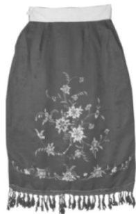
图 6: 江南大学民间服饰传习馆所藏民国初年女裙(一)

20 世纪初，妇女裙腰仍被保留，但是原来围系交叠处缝合为侧缝。其三，其他结构的变化，马面结构受西方大方、简洁服饰衣着观念的影响，裙门由宽变窄，到民国初年已逐渐消失，裙身侧衿已被对称式绣花纹样所取代，到民国初期西式面料开始运用并且裙子整体尺寸已趋于合体。如图 6 可以看出，裙腰已明显呈现出变窄趋势以适应人体腰围，这正是受西方窄衣文化的影响。随着清王朝封建政治体制的解体，西方服饰元素和审美意识的传入，在造型上女裙由过去宽肥平直开始向收身紧窄的 A 形裙演变，裙摆已提升到小腿或膝盖处。