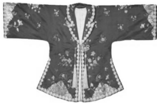
图12:江南大学民间服饰传习馆所藏民国服饰(三)

新郎穿西服,新娘身穿旗袍,披白纱,双方胸前佩戴红花,行鞠躬礼” [7] 。混搭风格已经发展成为当时婚礼服的一种时尚潮流。如图12江南大学民间服饰传习馆收藏一件民国婚礼服,以中式的连袖、对襟、盘金绣、袖口“阑干”形制搭配西式枪驳领。