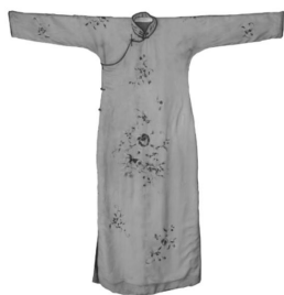
图3:20世纪20年代末收腰旗袍

包铭新先生认为:“旗袍是中西合璧的产物” [5] ,可见旗袍与兼收并蓄的多元思想有着直接的联系。民国改良旗袍经历两个阶段,第一个阶段是民初时期,仍然保留大襟右衽,盘扣,领襟镶、滚等传统要素,改直身为收腰,如图3(实地拍摄于江南大学民间服饰传习馆)成为“西