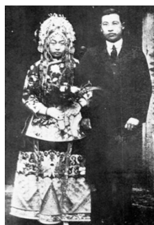
图11:20世纪30年代婚礼主要服装

新郎穿西服,新娘身穿旗袍,披白纱,双方胸前佩戴红花,行鞠躬礼” [7] 。混搭风格已经发展成为当时婚礼服的一种时尚潮流。如图12江南大学民间服饰传习馆收藏一件民国婚礼服,以中式的连袖、对襟、盘金绣、袖口“阑干”形制搭配西式枪驳领。