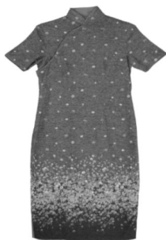
图 4: 民国 40 年代改良旗袍

风渐入”的标志性变化。此后袖型经历了倒大袖、窄袖到无袖的变化；绣饰由繁到简；旗袍整体的长度也经历了长曳至地到缩短脚踝，以至上升到膝盖的变化趋势。此阶段在西方文化观