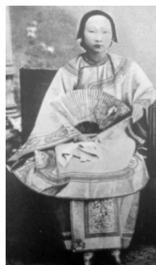
图1:中国传统的袄裙

“上衣下裳即上穿衣下穿裳,裳便是裙。上衣下裳是中国最早的服装形制之一,为汉服体系的第一个款式。”到近代这种服装形制依然是汉族女子主要的着装方式。中国传统的袄裙(图1)基本形制为立领、大襟右衽(或对襟)、连肩袖、袖身宽大平直、下摆开衩。衣身面料为暗花绸缎,大襟至侧襟及两侧开衩处刺绣或镶滚装饰,或是用素缎作底,上面刺绣图案,到清末,边饰发展到了异常繁琐复杂的状态,甚至将原来衣料完全掩盖了。这种