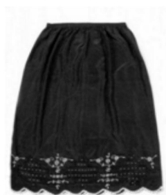
图7:江南大学民间服饰传习馆所藏民国初年女裙(二)

穿着方式上已由最初的围系式变为套穿式。如图7所示,传统马面裙已完成了向现代裙装的衍变,这些变化在五四前后从女学生率先穿着的“白衣黑裙”式的文明新装上得以充分体现。民国时代的