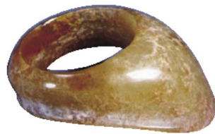
图2:玉鞞(明天启七年,1627),南京江宁殷巷沐睿墓出土。直径3.5厘米、宽1.2单位厘米 [8]

尽管汉末之后墓葬中不见有鞞出土,但这并不意味着没有鞞的使用。明初王彝(?-1374)曾有诗曰:“忆昔少年曾任侠,身轻欲飞衣袴褶。晓起冲寒行且猎,强箭如雨脱鞞鞞。” [7] 鞞是缠绕于左手小臂处束袖之物,便于射箭。诗歌描绘的就是一幅清晨策马射箭,乃至鞞、鞞都为之脱落的场景。可知鞞对于擅长骑射之人来说是常备之物,只是可能大多不用珍贵材料制作,易腐,且不为一一般人所特别关注。明代很少用玉做鞞,目前仅见的一例出于南京江宁殷巷沐睿墓,素面,矮端一侧表面有一道凹弦纹,无穿孔。形制简洁,无钮(图2)。沐氏家族是明代地位显赫的军事世家,其墓中出土的无孔玉鞞当是其战将身份和权力的象征物。