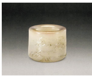
图3:白玉梅花纹扳指 高2厘米、直径2.5厘米,清宫旧藏。

从清宫传世的玉、翡翠扳指来看,它们在当时已经完全作为纯粹的装饰品,而不具备任何实用价值了(图3)。这些扳指,光素者表面光滑、圆润;有纹饰