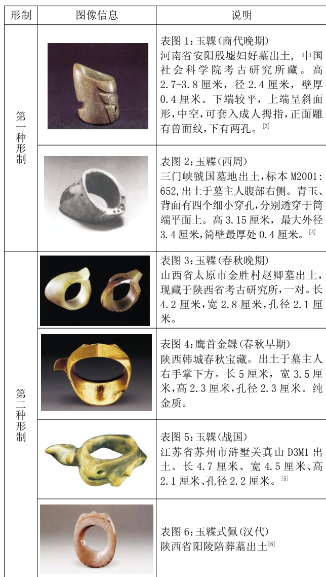
表1:中国出土鞞的代表形制图表

鞞在清代则演变成了扳指,被清代满族男子戴于右手大拇指上,尤以玉扳指为多。此外还有牙、骨、木、及各色贵重宝石,如翡