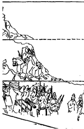
图6：太原市北齐娄叡墓西壁圆领缺胯袍

中南间”。明方以智《通雅》卷三十六：“分裾四”。清厉荃《事物异名录》卷十六：“《纲目集览》：‘开胯者，名缺胯衫，庶人服之。‘即今四衫”。一作“四袴衫” [16] 清汪汲《事物原会》卷三十八：“开胯者名缺胯衫，即今四胯衫也。唐马周制”。四胯衫即“缺胯衫”明张岱《夜航船·衣裳》：“马周制开胯。即今之四胯衫” [17] 。此议论之衫为唐圆领缺胯袍衫，虽衫与袍有别，但同一时代，缺胯之意应该相同。由此推论，缺胯袍应该是指开胯袍，即下摆部位前后左右各开一衩之袍，这一推论在五代、隋唐的壁画中多有体现证实。图6是太原市北齐娄叡墓发掘简报西壁总剖面图局部，从画面最下一排人物左面第二、三人所穿袍服中清晰可见这两件袍的下摆是在后面开衩的，第四人袍服袍的下摆是在旁边开衩的。