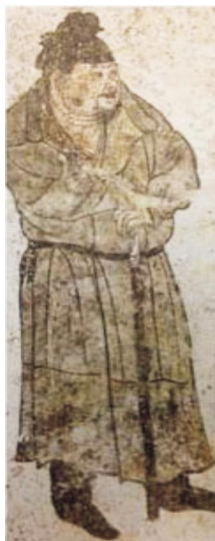
图1:(唐)李贤墓壁画中官员的服饰

相关记载还有紫襴即紫色襴袍,紫罗襴即以紫色细罗制成的襴袍,如图1。披袍是披搭于肩背的袍,形制较普通袍服为长。作用与披风类似,但披风无袖,披袍有袖,两袖通常垂而不用,多用于秋冬之季。《旧唐书·安禄山传》:“每见林甫,虽盛冬亦汗洽。林甫接以温言,中书厅引坐,以已披袍覆之。” [4] 五代后蜀孟昶《临江仙》词:“披袍窄地红宫锦,莺语时啭轻音。”