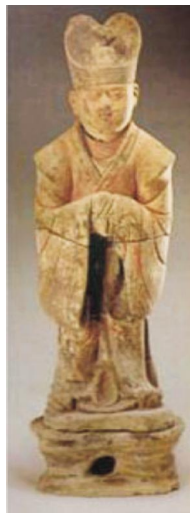
图2:唐金乡县主墓文官俑

民族服装中传承。交领根据两襟交汇点的不同,可以分为斜领和直领,交汇点靠上的称为斜领,唐时多为僧侣、隐士所服;靠下的称为直领,多为士庶百姓所服。曲领是一种宽阔的围领,一般连缀在襦袍之上,因宽大而曲得名,士庶男女日常家居均可服用,自隋代始被定为朝服所用,百姓则不再服用。圆领是贴身围合脖子的圆形领子,汉魏以前多用于胡服,六朝以后传入中原,男女皆可穿服,隋唐后用于官服。袂为袖中部位,是袖子的主体部分,所谓的大袖,主要是在肘关节为主的衣袖部分宽大,比如流行于五代及两宋时期的圆袂就是肘关节处宽大,腋和祛处收敛,形成圆弧,故名。隋唐时期这种大袖的款式主要在文官中流行,如图2。