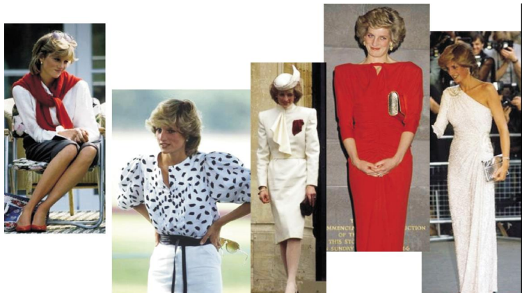
图 4: 英国戴安娜王妃的着装

在选择服装款式和图案时既要求经典又必须精致,配套感较强的服饰以及简洁的外轮廓。饱和度高的色彩让她充满神秘的贵族气质和端庄优雅的国际风范。戴安娜成功的着装不仅体现在选择款式和风格上的完美,还体现在她完全遵循国际形象设计“TOP”原则。在不同的时间、场合面对不同的受众以及出席目的时会谨慎选择适合的着装,当优雅变成一种生活态度,她独特的个人魅力也就浑然天成了(图 4)。