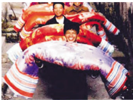
图 3: 婚庆用被褥(丝绸被面、色织土布被单)