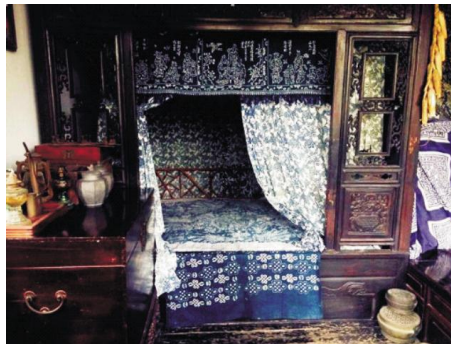
图 6: 南通蓝印花布馆藏传统家纺床品

南通传统家纺所用土布的精髓就在一个“土”字,它以天然植物染料的有机性以及手作布面的粗放肌理而表现出古朴的自然美感。由于传统土布都由织户自纺自织自染,纱线的条干不均匀以及手工投梭的随意性使得成品布面粗细不均,布面粗犷、质感自然。用于染色的植物蓝草是染青花布的重要原料,它同时也具有解毒、除热等药用功效。它染出的青色纯粹、质朴、健康,配合布面的天然质感,体现出一种大巧若拙、大朴不雕的自然美感。正是这种古拙的土布在机械化愈演愈烈的社会才显得弥足珍贵,它通过单纯的形式、真诚的情感来展现自身的魅力,让人们感受自然、亲和之美(图 6)。