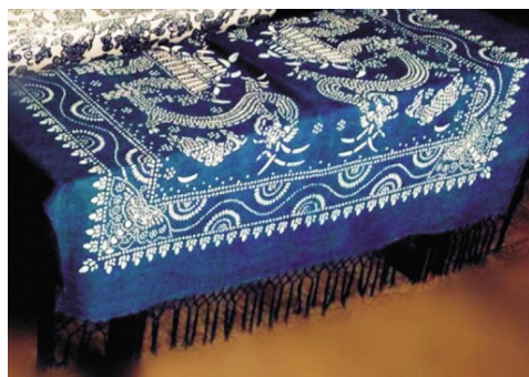
图 5: 蓝印花布装饰结合布

染竹节布的完美结合。而镶拼是传统家纺产品体现多样性、充分利用面料布幅的最好办法。例如传统被面上的“布档头”就是运用镶拼的方法将布缝于被头,以便于拆洗。