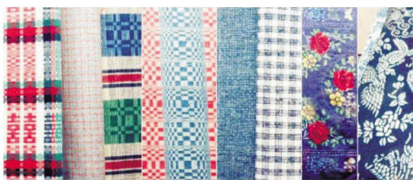
图2:南通传统土布的形制