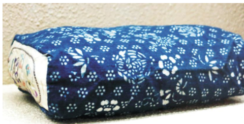
图 4: 传统婚庆用枕头

南通传统家纺工艺除土布本身的织造工艺之外,运用于家纺上的主要有刺绣、编结、缙丝和镶拼等技艺。南通的仿真绣、彩锦绣在中国刺绣史上占有相当重要的地位,传统家纺通常会根据当时的审美风情,将刺绣加以运用。图 3 为南通市纺织博物馆展示的南通传统土布枕,枕头两侧为本色布上植物花纹刺绣的拼接,与枕面的蓝印花布的花纹交相呼应,生动拙趣。编结工艺主要运用于家纺的边缘,以装饰性结为主,垂挂于门帘、挂饰、台布等的边缘,增加其美感(图 4~图 5)。南通的缙丝属缙丝中最古老的“本缙丝”流派 [6] ,在家纺中的主要运用于坐垫、屏风、装饰摆件类。2014 年 APEC 峰会上所使用的坐垫即为缙丝和传统蓝