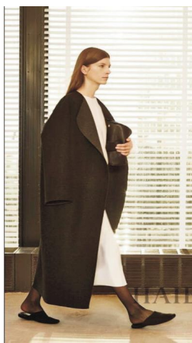
图 1 Christophe Lemaire 2015 秋冬系列 Fig.1 Christophe Lemaire's 2015 fall/winter fashion show series

Lemaire 在设计的道路上努力将 Normcore 风格运用在设计中并推进(图 1),这位主张现代实穿主义的小众设计师正越来越受到大家的关注,更重要的是他认为将 Normcore 风格的流行以及实穿二字对于普通女性来说有多么的重要,即简单基本款式穿出舒适的风格,在简单实用的设计里,设计师将平日里