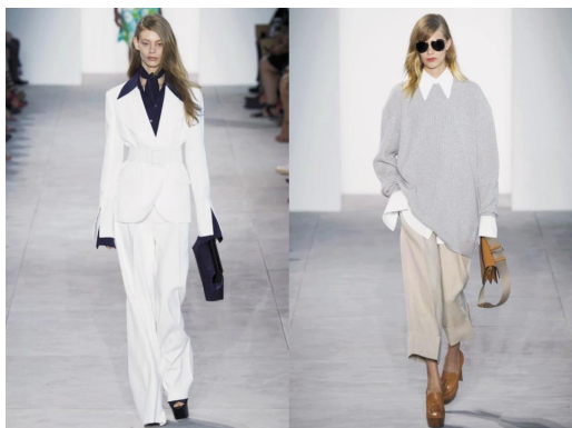
图3 Michael kors 2017年春夏秀场系列