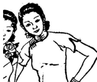
图9 袖口开衩的短袖款式