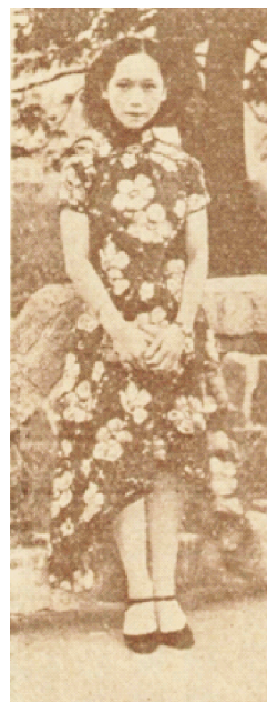
图3 廓形为A型的旗袍 Fig.3 The A-shaped Cheongsam