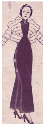
图13 用盘扣装饰的下摆开衩至膝盖以上的高开衩