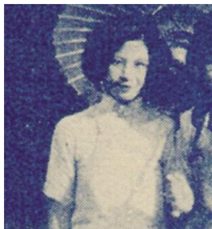
图10 袖口内低外高的设计

有袖口外侧做小开衩设计的袖型(图9),也有内低外高的斜向袖口设计的合体型,内低外高的斜向袖口即为靠近旗袍侧缝处的袖口低于对侧的袖口,这样的款式从正面看,两边袖口呈现出倒“八”的样式(图10);而中长