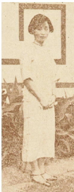
图1 长度至小腿中段左右的H型旗袍 Fig.1 The H-shaped Cheongsam from the middle shank