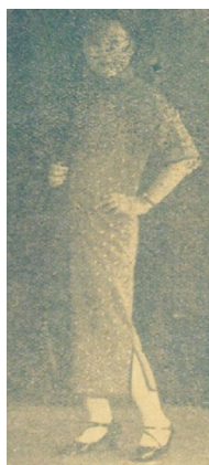
图12 下摆开衩至小腿肚的低开衩

20世纪30年代初期《玲珑》杂志中的旗袍开衩并不是很高,大致保持在膝盖左右,最低到小腿肚,最高至膝盖以上,并伴有盘扣的装饰(图12、图13)。笔者认为,此时的上层女性对