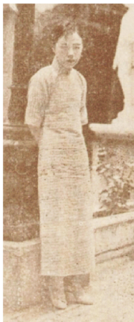
图2 长度及踝的H型旗袍 Fig.2 The H-shaped Cheongsam from the ankle