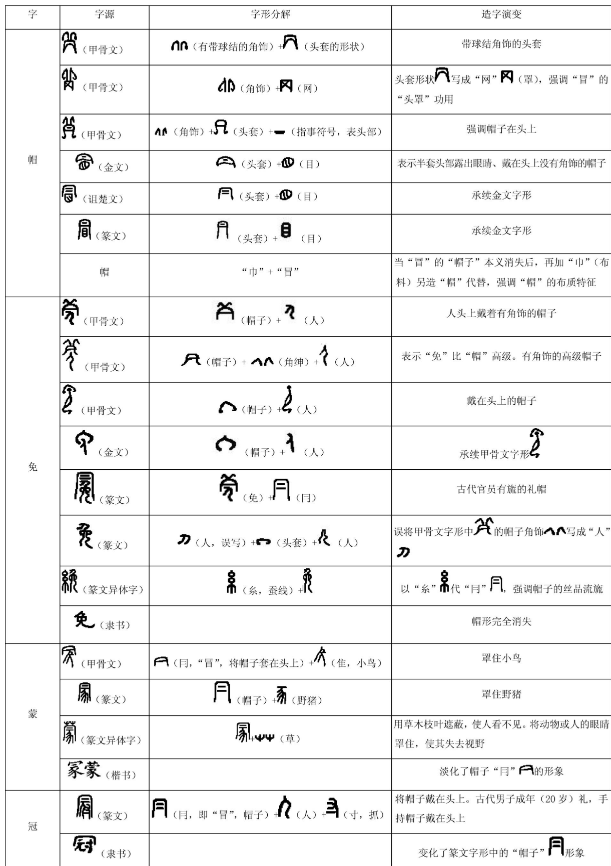
Tab.1 Character Development of 'Mao', 'Mian', 'Meng' and 'Guan'