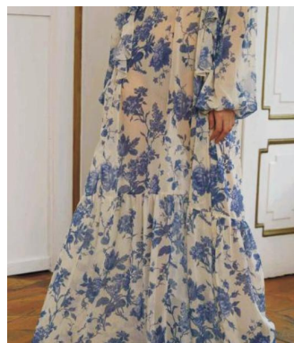
图 5 天门蓝印花布印花图案在雪纺面料上的表现