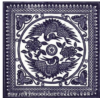
图 1 凤凰主题的天门蓝印花布

其次,把握天门蓝印花布的艺术特点。天门蓝印花布具有独特的风格与魅力,正是因为蓝印花布构图具有鲜明的地域特色。在开发设计的过程中,设计师需要使产品符合时代的要求,使这些产品能够有其鲜明的艺术特色,湖北天门蓝印花布在构图形式上追求完整,整体效果呈方中套圆的特点,图案饱满且铺满整个画面,饱满中又给人一定的遐想空间 [6] 。图案设计多按照规律的点、线、面进行排列,其构成点、线、面的形态和排列组合多种多样,从而带来虚实结合、或动静结合的艺术表现力。例如,在图 1 中以凤凰为主题的天门蓝印花布中,方形外框呈现上下左右对称式构图,圆形的点和不规则的线密集排列,具有强烈的视觉效果。而圆形圈内凤凰图案则用旋转向心式构图展示,所以整体画面构图丰富、且带有极强的节奏感强烈。