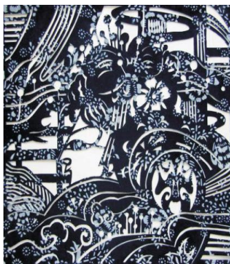
图 4 天门蓝印花布装饰画