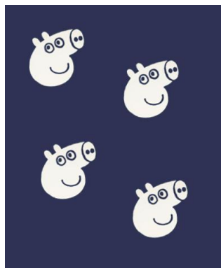
图 3 天门蓝印花布卡通图案设计图