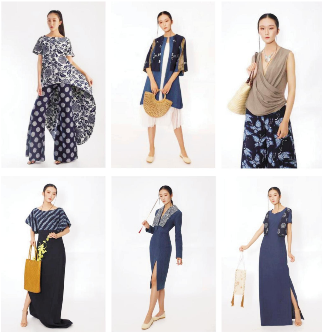
图6 蓝印花布服饰衍生品(笔者设计)

笔者对湖北天门蓝印花布运用于服饰品中,进行了长期的研究,并”携手天门蓝印花布省级传承人共同设计产品,意将天门蓝印花布的受用群扩大到不同的年龄阶段(图6),在保留传统纹样和技法的同时,创新服饰产品的设计,以小面积装饰、大面积运用的设计手法来创新天门蓝印花布的运用,使得天门蓝印花布能得到更具有生命力的传播与振兴。对天门蓝印花布的使用范围进行再创造,扩大其运用范围,不仅局限于小件用品、婚嫁床单等的使用,更多的可以出现在家居用品、服装、配饰以及生活用品上,使其更广阔的出现于人们的视野中,带动现代年轻人的认识度,从而更有力度带动湖北天门蓝印花布的复兴与发展。