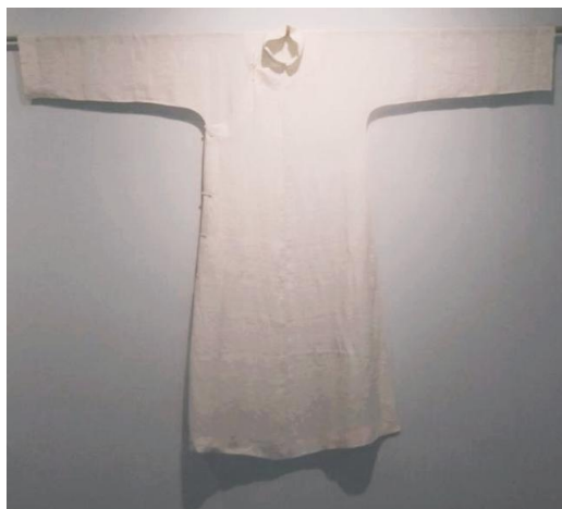
图2 闲云夏布藏民国时期夏布长衫

促进中国传统葛麻纺织服饰所呈现的古典美学,以活态的方式在当代麻织物生活用品中再现。以此达到弘扬优秀的传统文化,固守核心的传统工艺,并致力于创造性转化和创新性发展的目的。