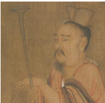
图3 唐孙位《高逸图》(局部),上海博物馆藏