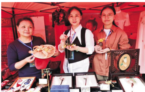
图3 武汉纺织大学参展现场