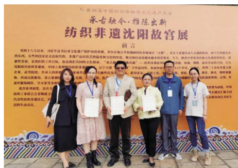
图2 武汉纺织大学代表合影