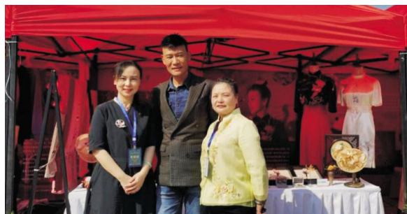
图4 著名服装设计师劳伦斯·许莅临指导